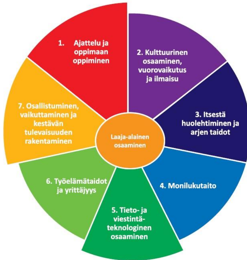
KUVA 1. Tiedot, taidot, arvot ja asenteet yhdistyvät laaja-alaisessa osaamisessa.

Opettaja auttaa oppilaita laaja-alaisen osaamisen taitojen tiedostamisessa ja ohjaa niiden kehittymistä. Omien taitojen tiedostaminen vahvistaa pystyvyyden tunnetta ja innostaa oppimaan. Laaja-alaisen osaamisen taidot otetaan huomioon oppiaineiden arvioinnissa. Oppilaille ja huoltajille annetaan tietoa osaamisen edistymisestä erityisesti nivelkohdissa.