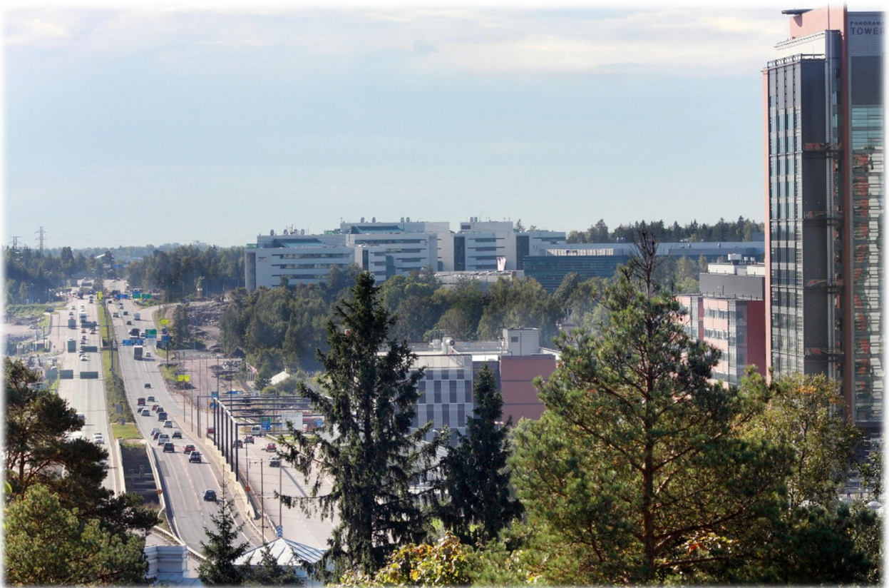
Espoon suuralueista eniten alkuvuonna kasvoi Leppävaara noin 1 000 asukkaalla.

Kuntalain mukaisesti tarkastuslautakunnan tehtävänä on arvioida valtuuston asettamien toiminnan ja talouden tavoitteiden toteutumista kunnassa ja kuntakonsernissa sekä onko toiminta järjestetty tuloksellisella ja tarkoituksenmukaisella tavalla. Vuosittain laadittavan arviointikertomuksen lisäksi Espoon tarkastuslautakunta antaa valtuustolle lausunnot toisesta ja kolmannelta osavuosisikatsauksesta sekä tammi-kesäkuun ja tammi-syyskuun konserniraporteista.