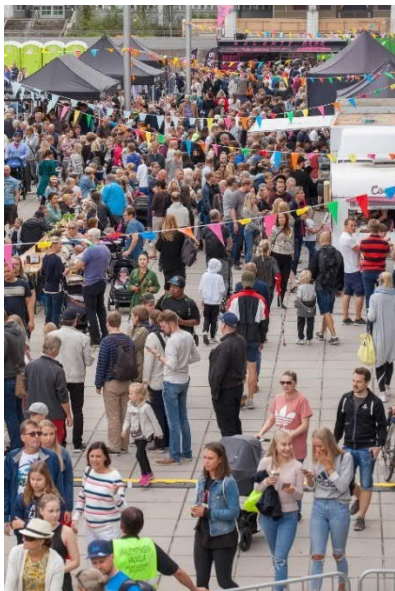
Espoo-päivä 2018, Makujen Tapiola -tapahtuma.

Espoon asukasmäärän kasvu tammi-kesäkuussa oli 3 263. Vieraskielisten asukkaiden osuus väestönkasvusta oli 54 prosenttia.