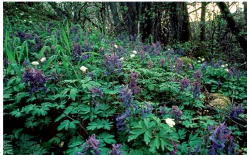
pystykiurunkannus ja valkovuokko

Huomattava osa Länsiväylän pohjoispuolisesta Espoonlahden perukasta on Espoonlahden–Saunalahden Natura-alue, josta yli puolet ulottuu Kirkkonummen puolelle. Lähes koko Espoon puoleinen Natura-alue on Espoonlahden suojelualue. Sen pinta-ala on runsaat 200 hehtaaria, ja siihen kuuluu Fiskarsinmäen lehto- ja niittyalueita, rantaruovikkoa sekä yksityisomistuksessa olevaa ranta- ja vesialuetta.