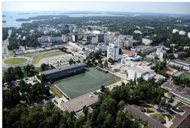
Ilmakuva Tapiolasta kesällä 2019.

Peruskaupungin investointeihin on muutetussa talousarviossa varattu 400 milj. euroa. Syyskuun loppuun mennessä investointien toteutuma on 209 milj. euroa. Määrärahan käytön ja tiedossa olevien investointihankkeiden aikataulujen muutoksista johtuen vuoden 2019 investointien kokonaisarvoksi arvioidaan 375 milj. euroa. Investointien tulo-rahoitusprosentiksi muodostunee 50 prosenttia.