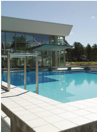
Tapiolan uimahalli

Maanhankintaan on talousarviossa varattu 8 milj. euroa, josta heinäkuun loppuun mennessä oli käytetty 5,6 milj. euroa. Osavuosikatsauksen yhteydessä maanhankintaan on esitetty 4 milj. euron lisäystä Kaitaan rantapuiston lunastamiseksi 1,45 milj. eurolla sekä maankäyttösopimukseen sisältyvien esisopimusten täytäntöönpanoa varten 2,5 milj. euroa. Soukan Puotitalon hankintaa varten on osakkeisiin ja osuuksiin varatuista määrärahoista jo siirretty maa- ja vesialueisiin 0,9 milj. euroa. Maa-alue on hankittu Soukan metroaseman rakentamista varten.