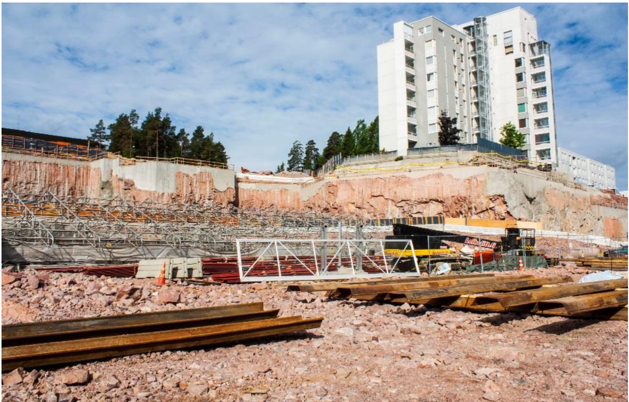
Metroyömaa Espoonlahdessa kesäkuussa 2018

Länsimetron II-vaihe on etenemässä louhinnoista rakentamiseen. Urakoitsijoiden kilpailutukset tehdään vuoden 2018 aikana.