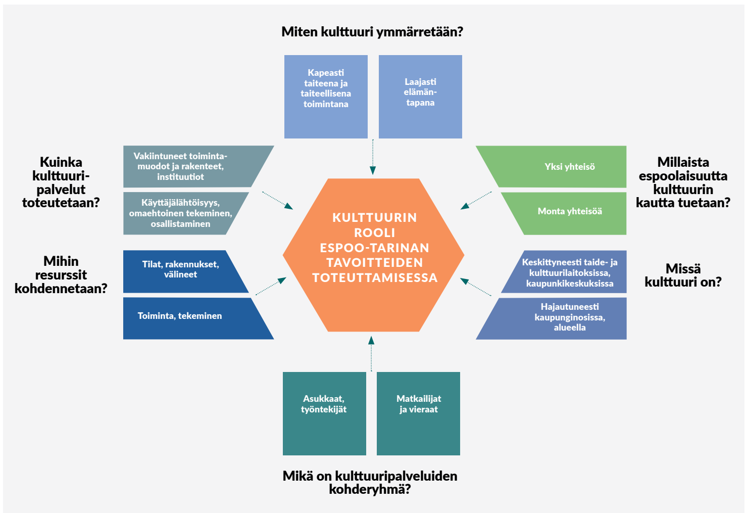
Kuvio 1. Kulttuuri ja kaupunkikehitys. 3